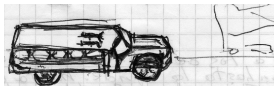
Ilustración de Don Chuy

“Don Chuy de los Pedregales”, calle Mixtecas.