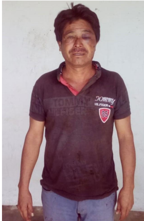
Detenido y torturado el 17 de julio de 2019, actualmente preso